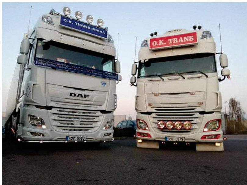
1. místo

Začátkem června jsme na naší facebookové stránce spustili soutěž pro řidiče. Všem zúčastněným děkujeme za záplavu fotek a výhercům gratulujeme!